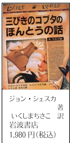
ジョン・シエスカ 著 訳 いくしまちさこ 岩波書店 1,980円(税込)

おなじ出来事でも少し視点を変えてみると、 そこには全く違う考え方がるように、物事は 一方からみるだけでは不十分であることを、お もしろおかしく教えてくれます。絵にも細かい 工夫がされています。絵本ですが、親子で一緒 に楽しんでいただけるので是非、手に取ってみ てください。